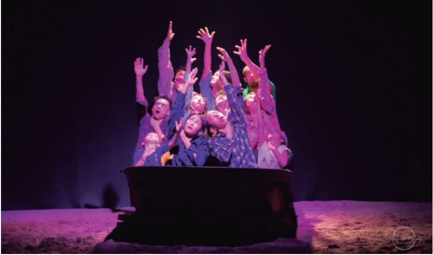
“The Boat” antzeziana.