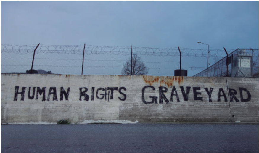
Lehengo Moria kanpamentua, Lesbos, 2021.